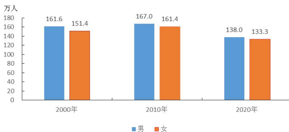
图3-1 全市历次人口普查人口性别数

全市常住人口 [2] 中，男性人口为1380002人，占50.87%；女性人口为1332892人，占49.13%。人口性别比（以女性为100，男性对女性的比例）由2010年第六次全国人口普查的103.52上升为103.53。