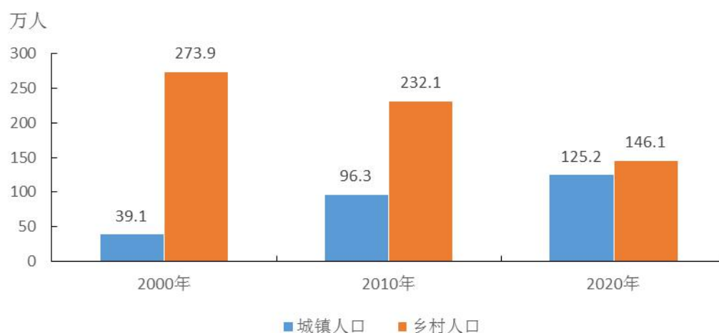
图6-1 全市历次人口普查城乡人口

全市常住人口 [3] 中，居住在城镇的人口为1252293人，占46.16%；居住在乡村的人口为1460601人，占53.84%。与2010年第六次全国人口普查相比，城镇人口增加289704人，乡村人口减少860581人，城镇人口比重上升16.85个百分点。